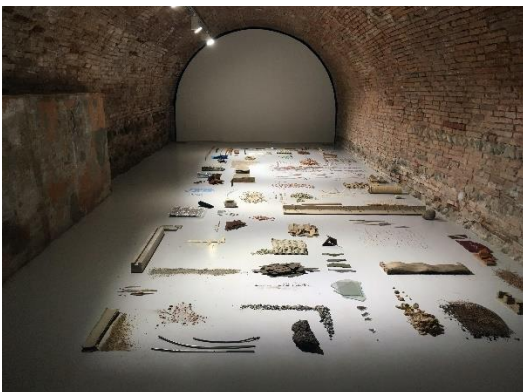
Maria Tackmann Installation dans le cadre de l'exposition Milieu , Espace Ecureuil, Toulouse, 2021 © Maria Tackmann