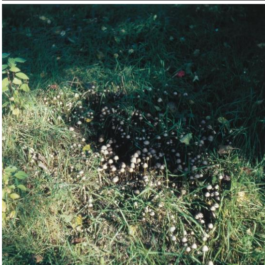
Arno Schmidt (1914-1979) Sans titre, sans date Photographie en couleur Tirage d'exposition 2024 50 cm x 50 cm