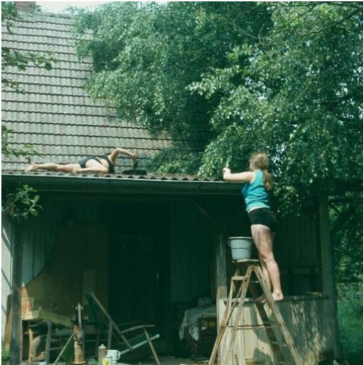
Arno Schmidt (1914-1979) Sans titre, sans date Photographie en couleur Tirage d'exposition 2024 50 cm x 50 cm