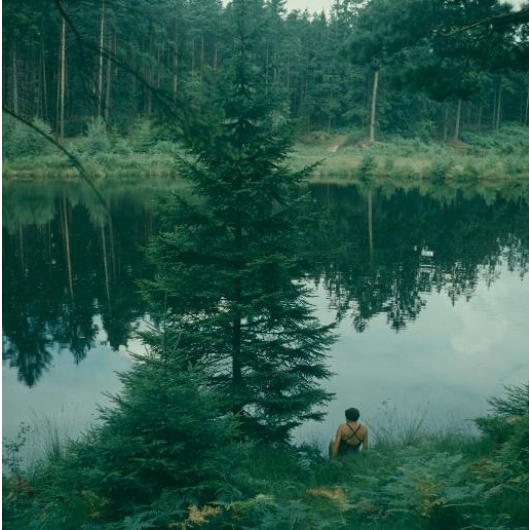
Arno Schmidt (1914-1979) Sans titre, sans date Photographie en couleur Tirage d'exposition 2024 50 cm x 50 cm