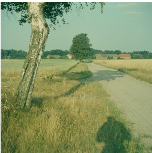
Arno Schmidt (1914-1979) Sans titre, sans date Photographie en couleur Tirage d'exposition 2024 50 cm x 50 cm