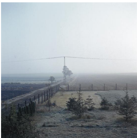
Arno Schmidt (1914-1979) Sans titre, sans date Photographie en couleur Tirage d'exposition 2024 50 cm x 50 cm

Toutes les images peuvent être téléchargées sur www.mbac.ch dans la rubrique « Presse ».